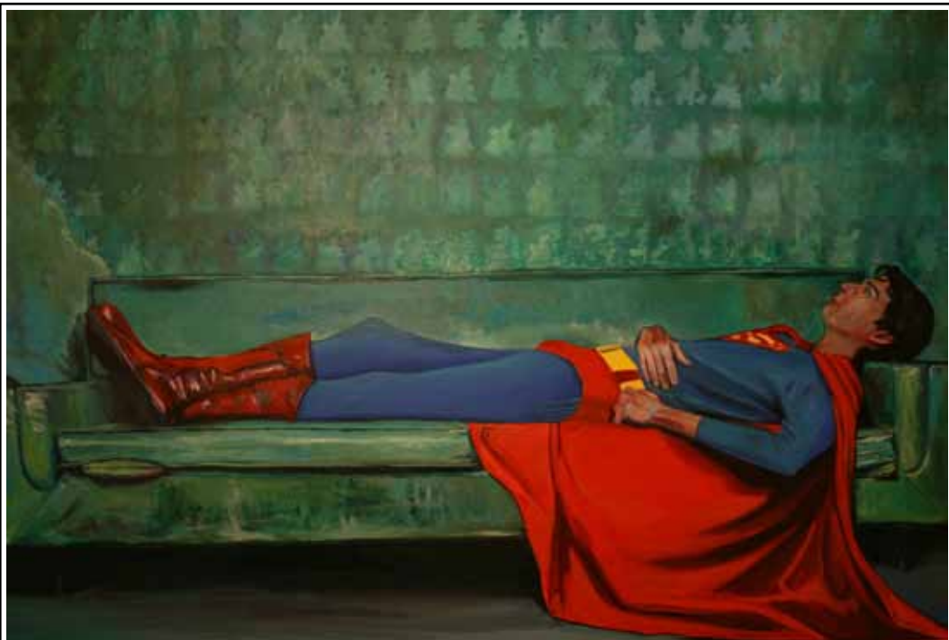
Superman en terapia (0.90 x 0.60 cm.)