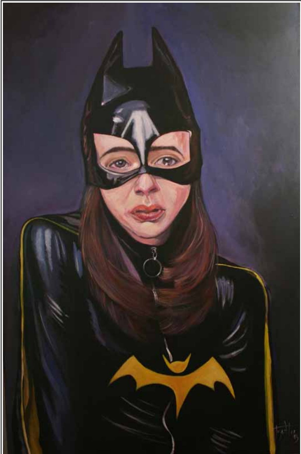
Batichica llorando (0.73 x 110 cm.)