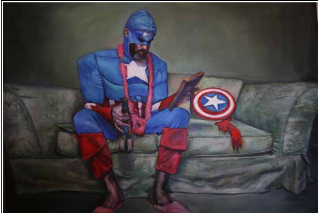
American Way of Life (0.80 x 1.20 cm.)