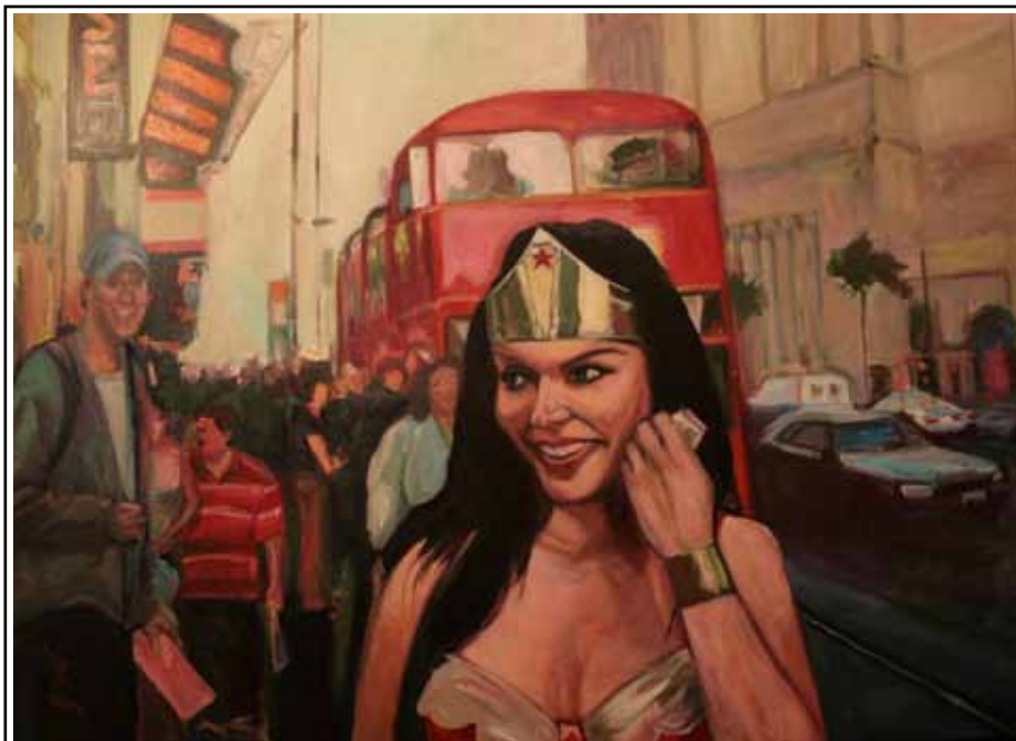
Ticket to Ride (1.00 x 0.80 cm.)