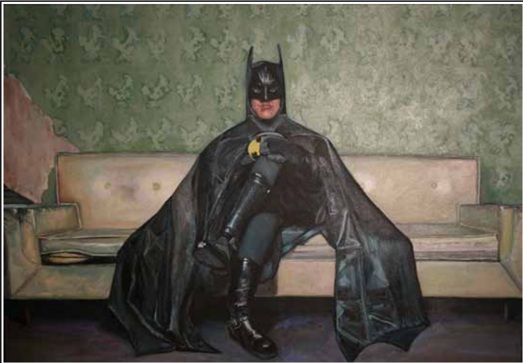
Batman en terapia, Abatido (1.00 x 0.80 cm.)