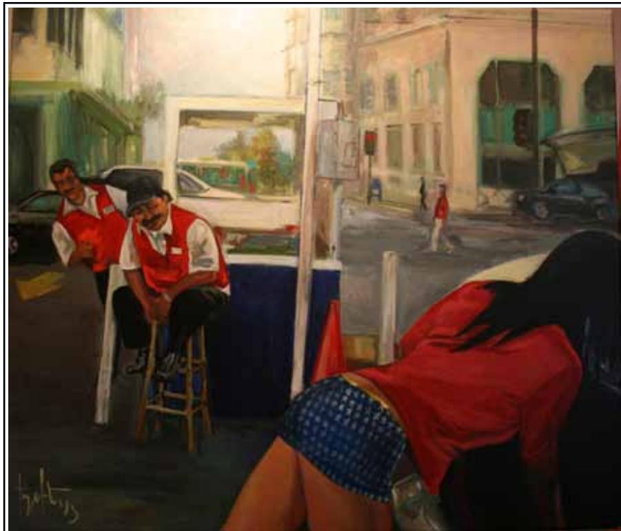
Wonderwoman Full Service (0.60 x 0.70 cm.)